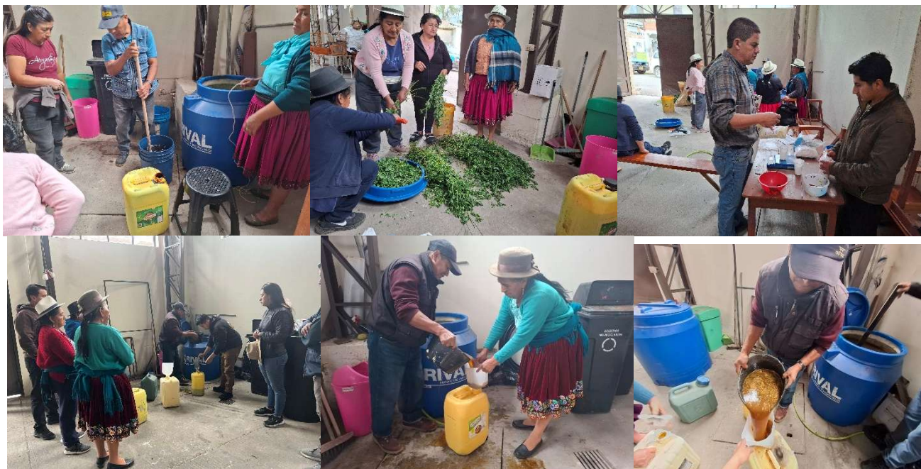
Foto 78: Taller de cosecha de biol magro y entrega a productores de la parroquia

Se gestionó el taller práctico de elaboración, cosecha y entrega de biol magro, abono orgánico que contribuye al mejoramiento de la producción agrícola. Esta iniciativa promueve prácticas sostenibles y fortalece las capacidades productivas de los agricultores de la parroquia.