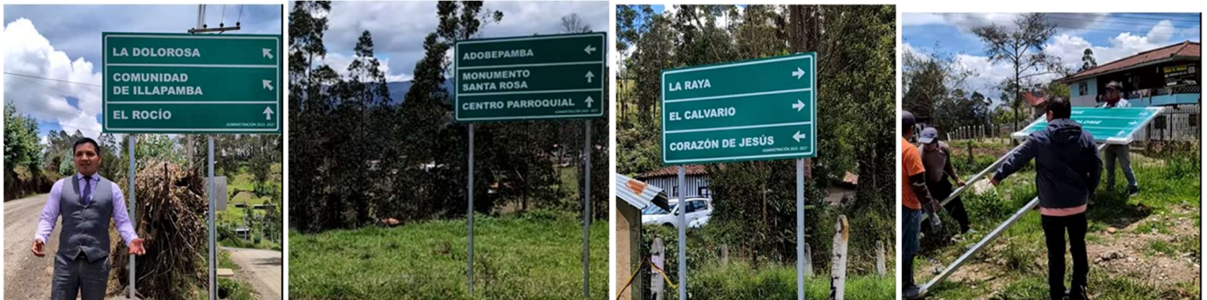
Foto 93: Implementación de señalética en las comunidades de la parroquia