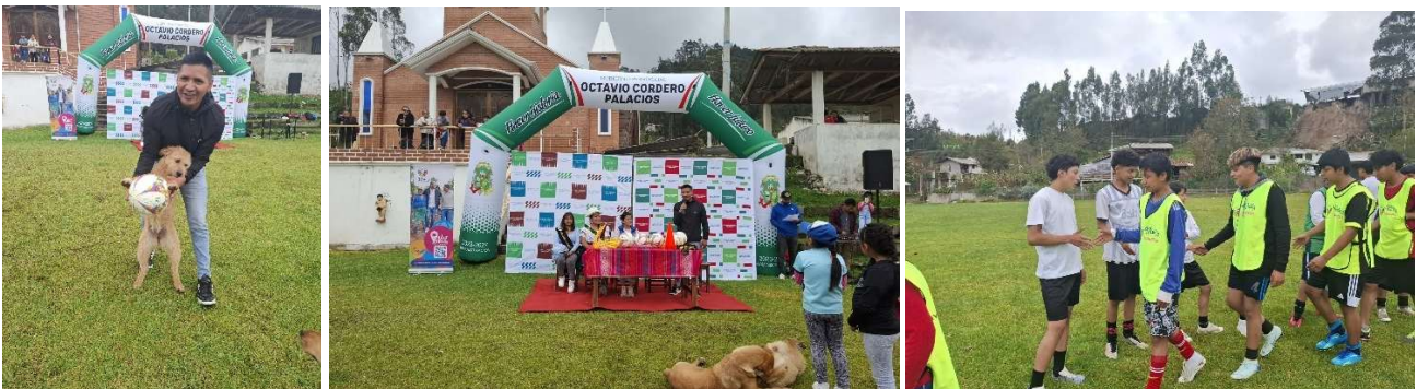
4. Foto 57: Inauguración de Espacios Recreativos impulsado por la Prefectura del Azuay

Gracias a la Gestión institucional se implementó la Escuela de Fútbol para niños, niñas y adolescentes de la parroquia, como parte de un proyecto impulsado por la Prefectura, del cual la parroquia fue beneficiaria. Esta iniciativa está orientada a fomentar la actividad física, el trabajo en equipo, la disciplina y los valores deportivos desde edades tempranas, brindando una alternativa saludable para el uso del tiempo libre y contribuyendo al desarrollo integral, la inclusión social y el fortalecimiento de una comunidad más activa y unida.