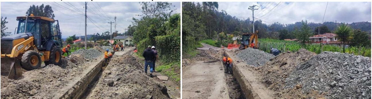
Foto 41: Trabajo de mejoramiento del sistema de alcantarillado en el centro parroquial

Inversión: 40.000,00 USD (Firmado en 2024)