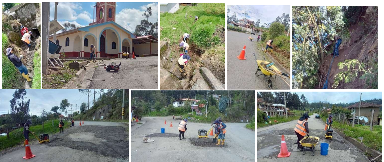
Foto 112: Trabajos de mantenimiento de veredas y cunetas – convenio ELECAUSTRO