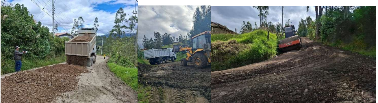
Foto 50: Minga de mantenimiento vial con el Municipio de Cuenca Corazón de Jesús