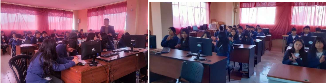
Foto 87: Talleres de bienestar emocional a niños, niñas y adolescentes

y adolescentes. Estas actividades contaron con el valioso aporte profesional que permitió su adecuada ejecución.