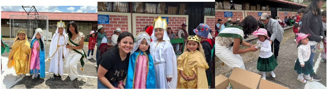
Foto 83: Agasajos a niños y niñas de la escuela Octavio Cordero Palacios