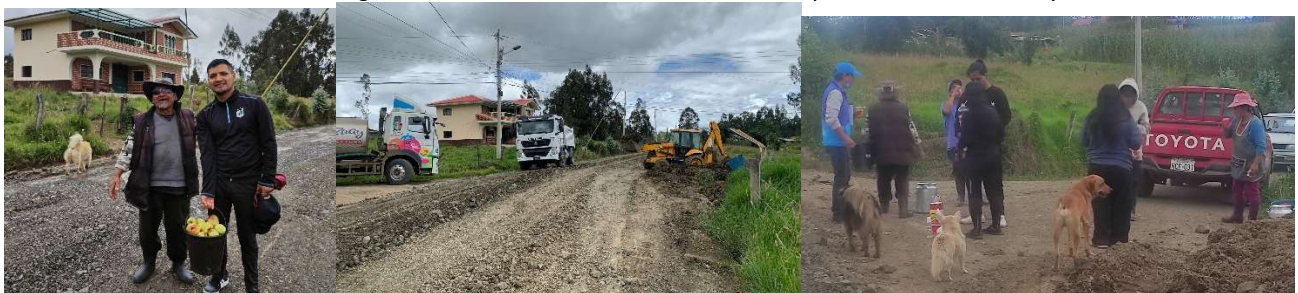
Foto 45: Minga de mantenimiento vial con Prefectura – El Cisne Puente Gahuiña