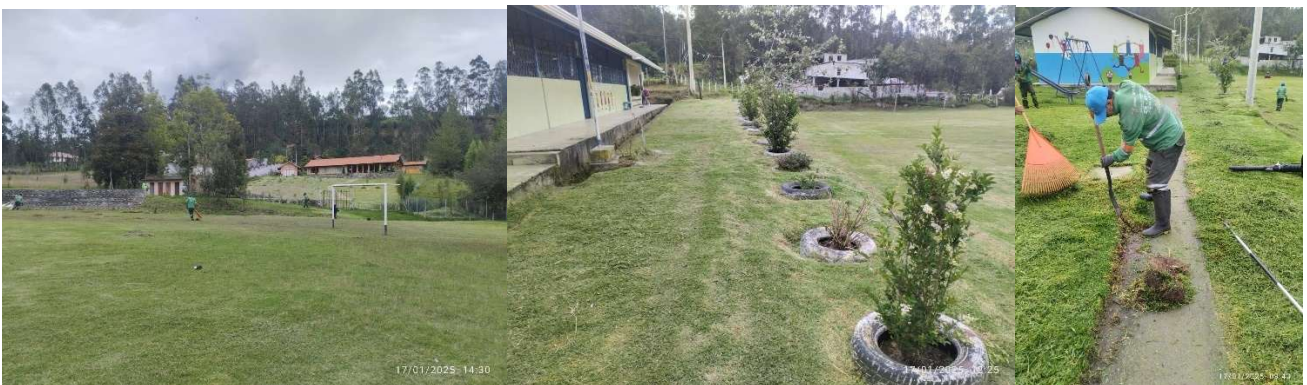
Foto 114: Trabajo de podado de podado de área verdes de la parroquia

En coordinación con EMAC EP, se realizaron actividades de poda y mantenimiento de los espacios verdes de la parroquia una vez cada mes, promoviendo un entorno limpio, ordenado y seguro para la comunidad