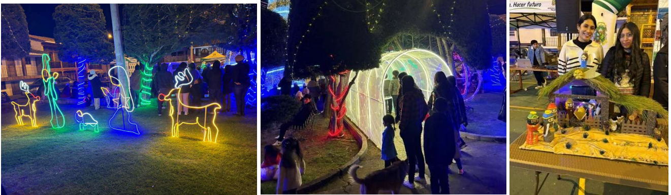
Foto 97: Evento navideño "Octavio Cordero Palacios Vive la Navidad 2025"