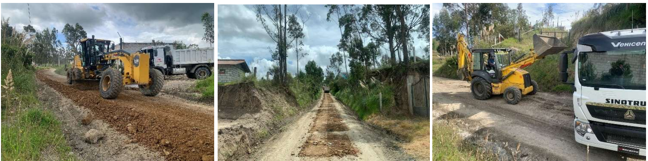
Foto 18: Programa de mantenimiento vial – La Raya Corazón de Jesús