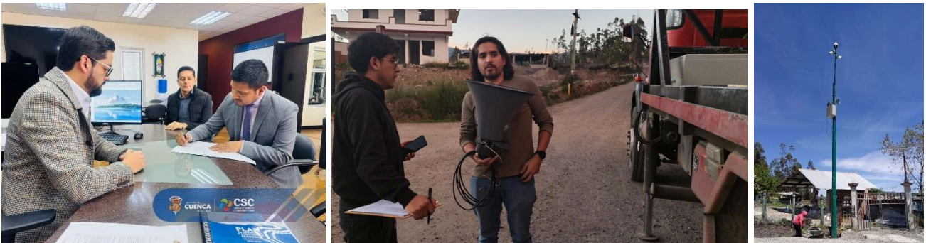
3. Foto 15: Implementación de sistema de videovigilancia en la parroquia