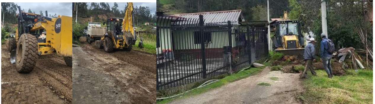
Foto 47: Minga de mantenimiento vial con el Municipio de Cuenca – San Vicente