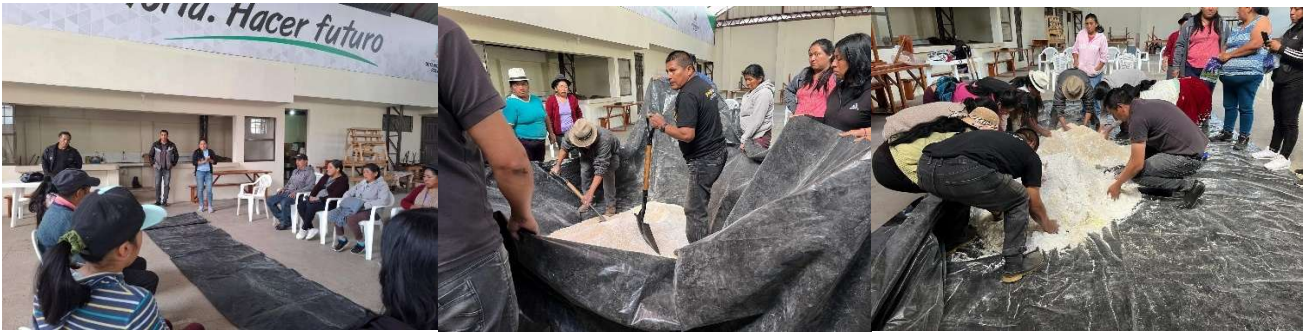
Foto 73: Taller práctico de elaboración de sal mineral para ganado bovino