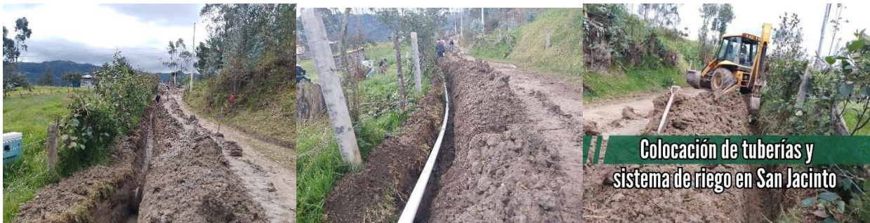
Foto 91: Instalación de tuberías del sistema de riego en la comunidad de San Jacinto

Con la retroexcavadora institucional se llevan a cabo labores de instalación de tuberías de riego en la comunidad de San Jacinto, como parte de las acciones orientadas al fortalecimiento de la infraestructura agrícola.