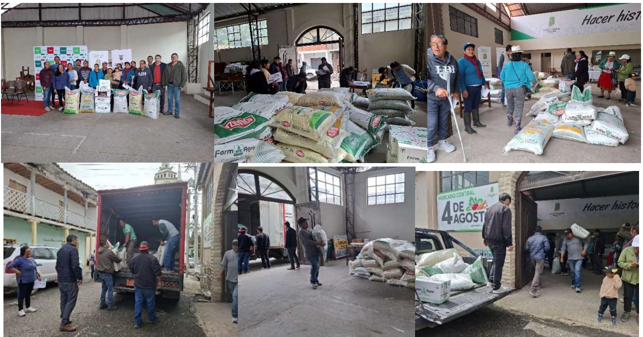
Foto 72: Entrega de kits agrícolas a productores por parte del MAG

Se gestionó la entrega de kits de insumos de nutrición y fitosanitarios por parte del Ministerio de Agricultura y Ganadería – Coordinación Zona 6, destinados a productores de la parroquia. Este aporte contribuye a mejorar la productividad, fortalecer las actividades agropecuarias y promover prácticas sostenibles en beneficio de las familias