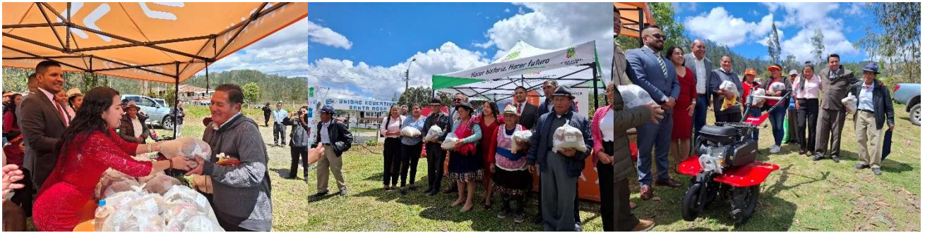
Foto 30: Entrega de semillas de pasto y motoazada agrícola beneficiarios