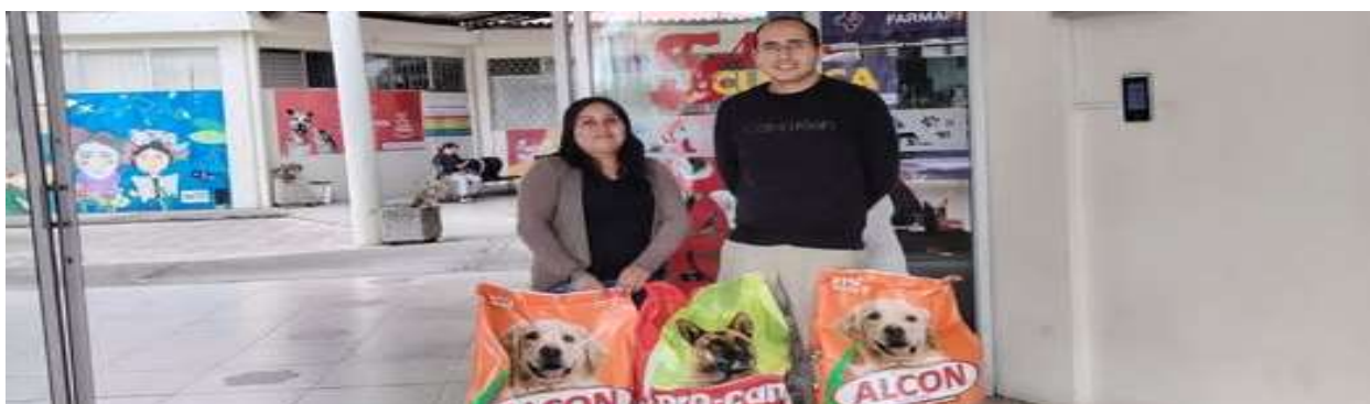
Foto 64: Donación de alimento para mascotas a la Comisión de Gestión Ambiental