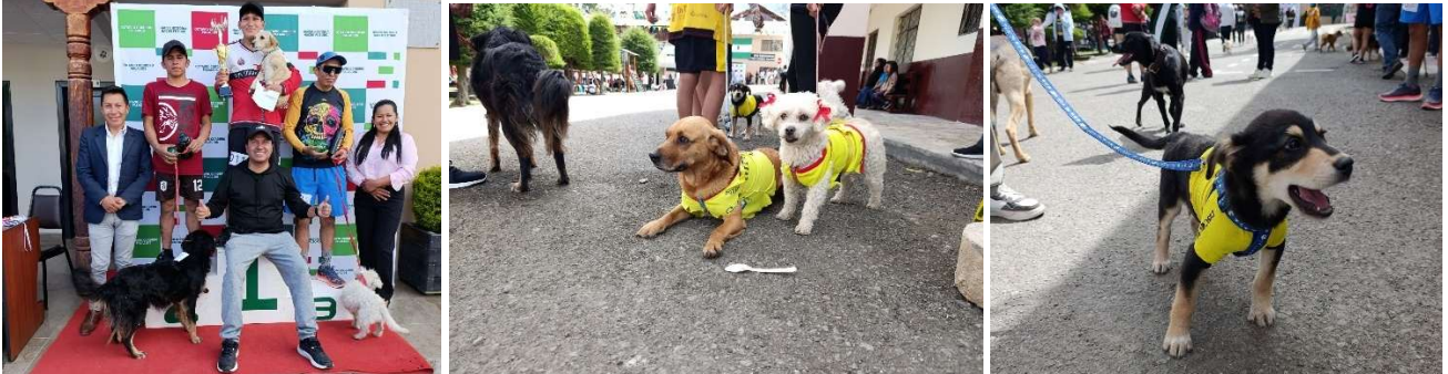
Foto 59: Evento “Perrotón – III Edición” en conmemoración de los 171 años de fundación de la parroquia

Se llevó a cabo el evento “Perrotón – III Edición”, desarrollando una jornada de integración, recreación y promoción del cuidado responsable de las mascotas, con la participación de familias de la parroquia junto a sus animales de compañía, fomentando la convivencia comunitaria, el bienestar animal y el fortalecimiento de una cultura de responsabilidad y respeto hacia los animales.