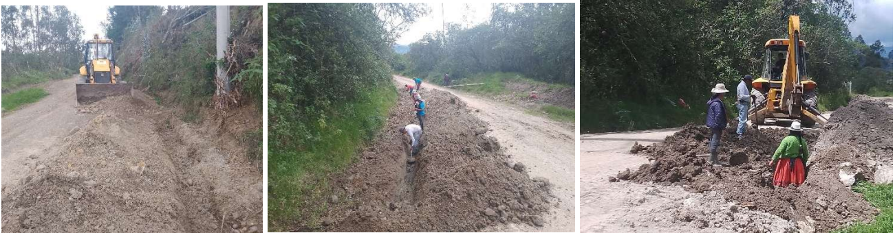
Foto 88: Trabajos de intervención comunitaria Azhapud y Adobepamba

Se ejecutaron trabajos en las comunidades de Azhapud y Adobepamba con apoyo de personal institucional, maquinaria y la activa participación de la comunidad. Estas acciones reflejan el compromiso conjunto por el desarrollo y mejoramiento de la parroquia.