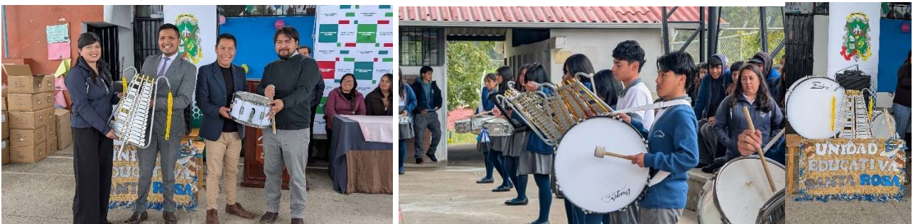
Foto 94: Entrega de Instrumentos Musicales en la Unidad Educativa Santa Rosa