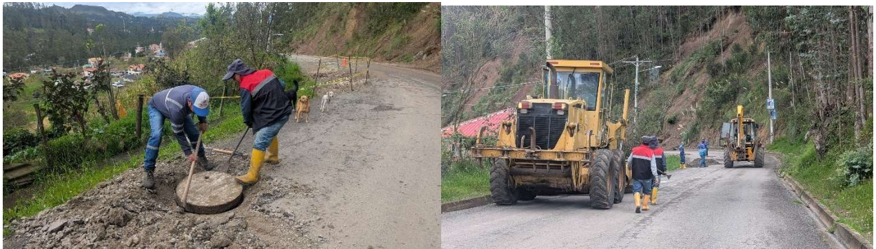
Foto 46: Minga de mantenimiento vial con Prefectura – Cristo del Consuelo - San Vicente