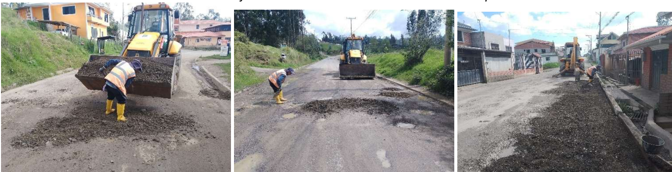
Foto 101: Trabajos de mantenimiento vial – Cristo del Consuelo Parcoloma