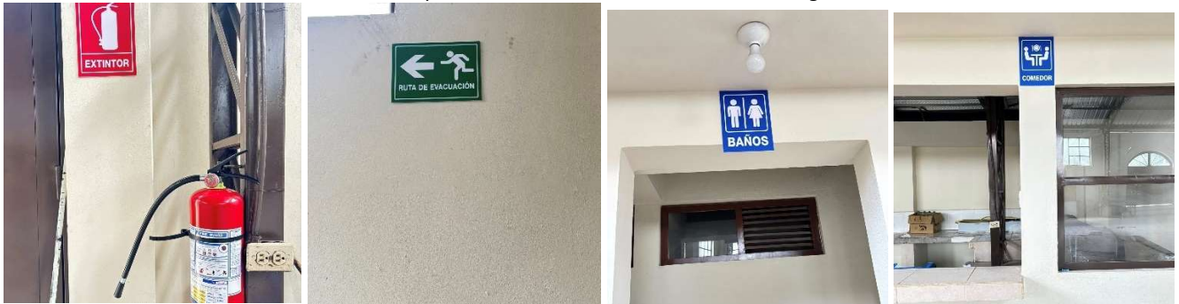
Foto 28: Implementación de señalética en el mercado central 4 de agosto