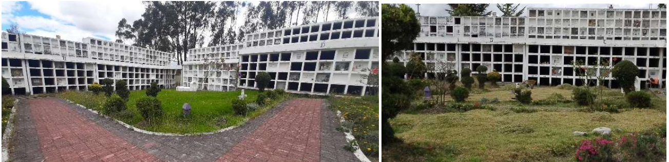
Foto 98: Servicio de inhumaciones, exhumaciones y actividades complementarias