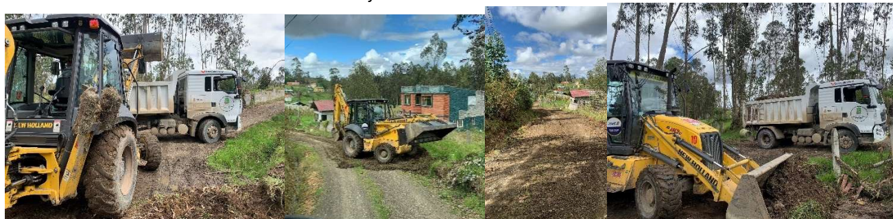
Foto 109: Trabajos de mantenimiento vial - Comunidad Santa Marianita