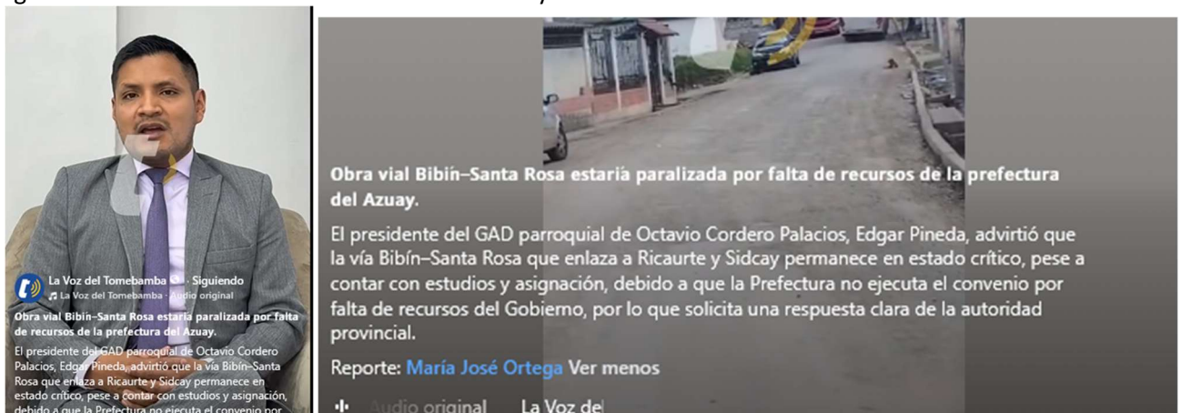
Foto 117: Gestión en medios de comunicación sobre la situación de la vía Bibín-Santa Rosa

Se realizó la gestión en medios de comunicación para visibilizar la situación de la vía Bibín – Santa Rosa, evidenciando su estado crítico pese a contar con estudios y asignación, con el objetivo de solicitar una respuesta oportuna por parte de la Prefectura del Azuay y promover la atención a esta necesidad prioritaria, fortaleciendo la gestión institucional en favor de la conectividad y el bienestar de las comunidades.