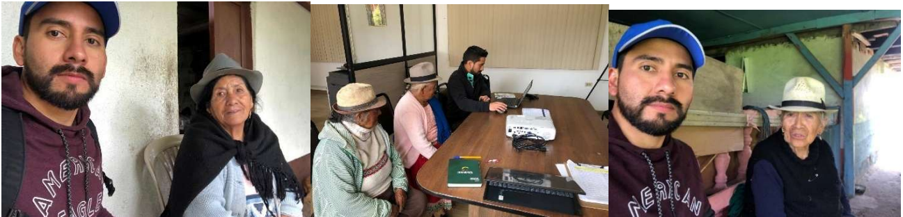
Foto 113: Visitas domiciliarias al adulto mayor – Convenio con el MIES

Inversión: 4817.48 (Primer periodo) USD 6.524,92 (Segundo periodo)