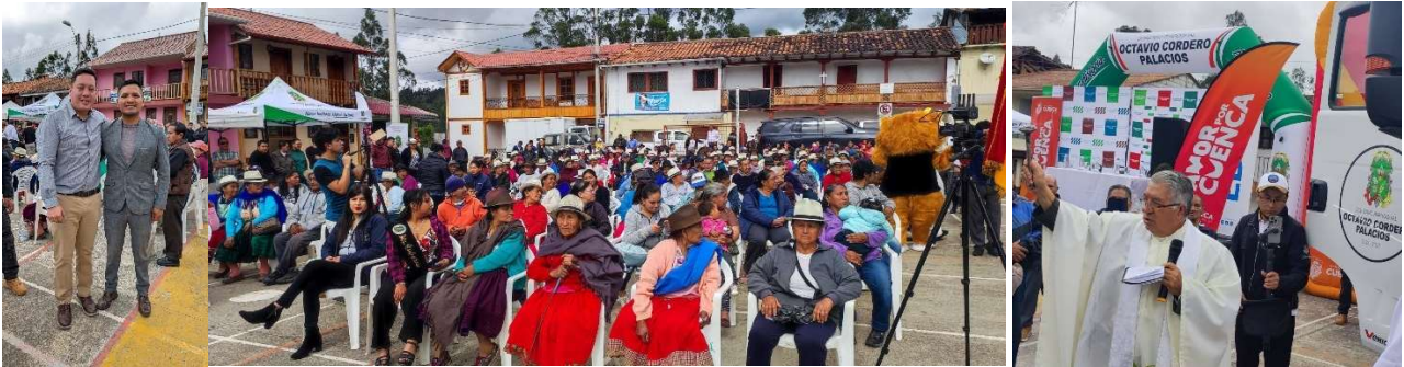
Foto 39: Entrega simbólica de volqueta y de kits alimenticios por el GAD Municipal de Cuenca