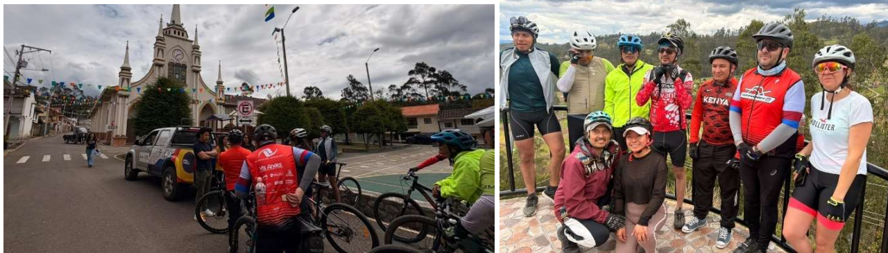
Foto 62: Jornada ciclística en la parroquia en el marco de “Rutas Rurales”

Se coordinó una jornada ciclística de montaña en la parroquia en el marco de “Rutas Rurales”, con la participación de ciclistas de distintas edades, quienes recorrieron senderos naturales y paisajes, promoviendo la actividad física, la vida saludable y el turismo rural, así como la valoración de la riqueza ambiental y cultural del territorio mediante la integración comunitaria y el contacto directo con la naturaleza.