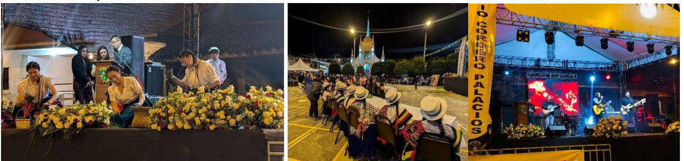
Foto 95: Elección de Reina y proclamación de la cholita parroquial 2025-2026