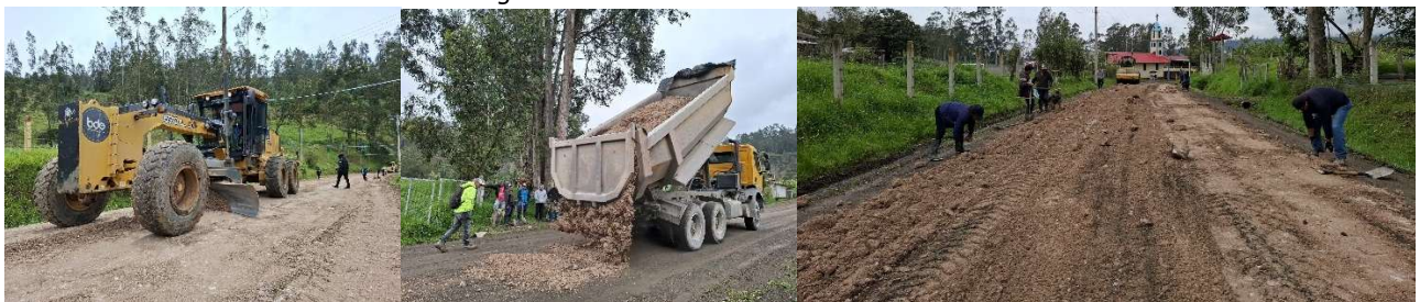
Foto 44: Minga de mantenimiento vial con GAD Municipal – El Calvario La Raya