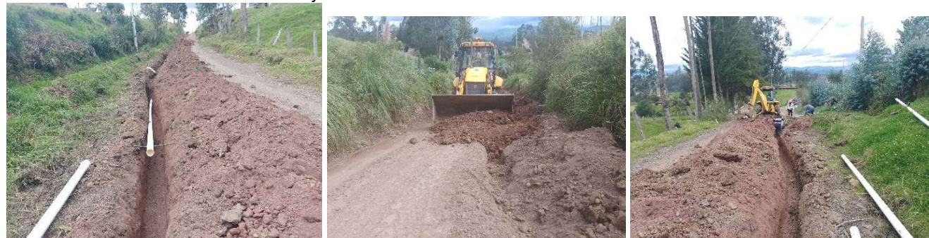
Foto 104: Trabajos de mantenimiento vial – Rocío en la vía al Chine