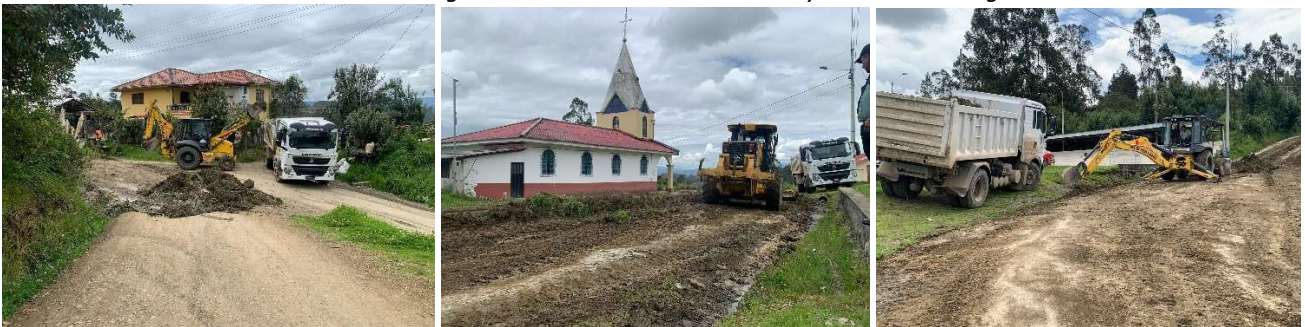
Foto 20: Programa de mantenimiento – Corazón de Jesús – San Jacinto