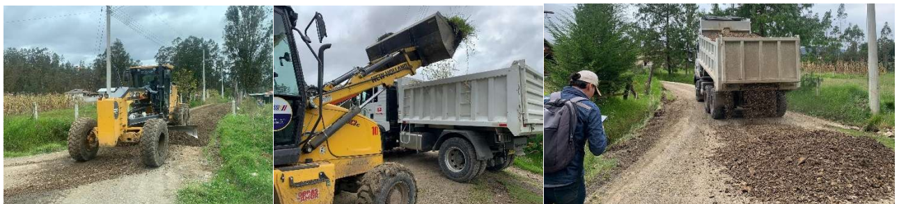
Foto 49: Minga de mantenimiento vial con Prefectura – Comuna Adobepamba