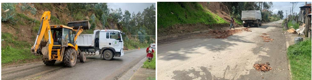
Foto 92: Trabajos de recuperación de veredas en el sector de San Vicente

Se realizaron los trabajos de recuperación de veredas en el sector San Vicente, con el objetivo de mejorar la movilidad peatonal y las condiciones de seguridad para la comunidad.