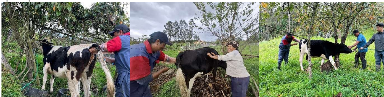
Foto 77: Programa de Mejoramiento Genético Bovino a través de la Inseminación Artificial a Tiempo Fijo

Se gestiona el seguimiento el proyecto de inseminación artificial a tiempo fijo (IATF), en coordinación con el Ministerio de Agricultura y Ganadería (MAG), orientado a mejorar la genética del ganado bovino. Esta intervención contribuye a incrementar la calidad, productividad y competitividad de la producción ganadera en la parroquia.