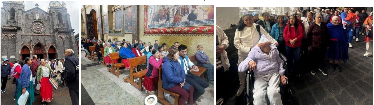
Foto 7: Visita al Santuario y Basílica Católica Nuestra Señora del Rosario de Agua Santa