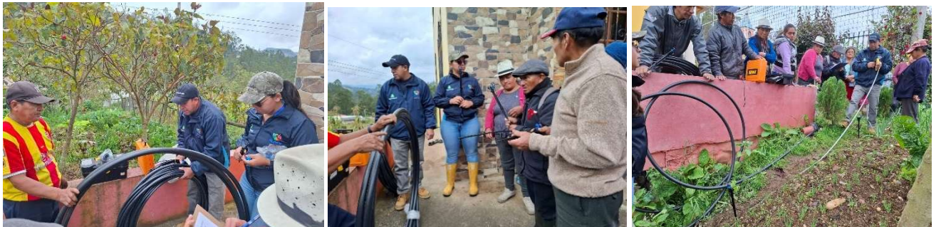
Foto 69: Taller teórico-práctico sobre instalación y manejo de sistema de riego por microaspersión

Se gestionó un taller teórico-práctico sobre la instalación y manejo de sistemas de riego por microaspersión en la comunidad de San Vicente, en el marco del proyecto “Sistema Productivo de Hortalizas” en coordinación con AgroAzuay. Esta actividad permitió optimizar el uso del agua y fortalecer la productividad agrícola de los beneficiarios.