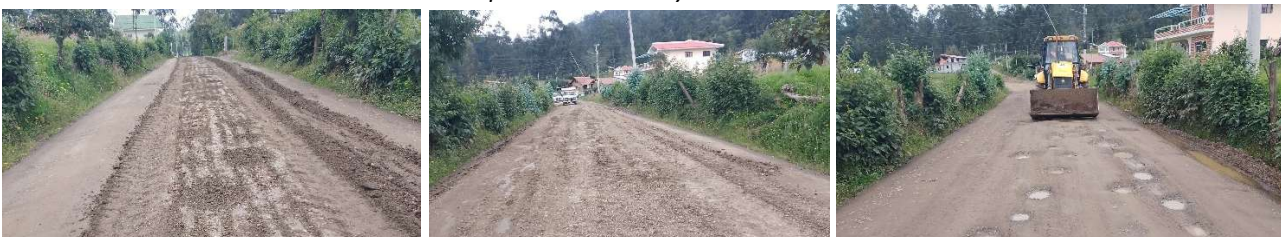
Foto 103: Trabajos de mantenimiento vial – Comunidad Santa Marianita