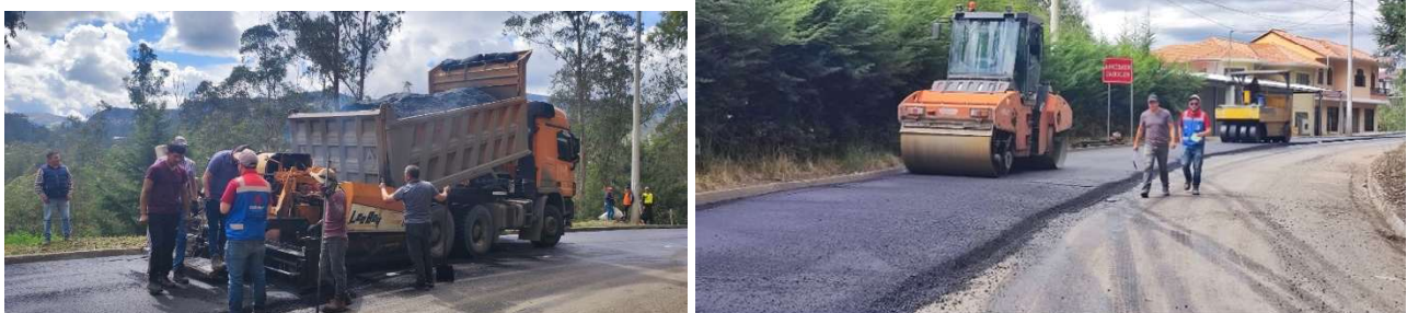
Foto 38: Mejoramiento vial en el tramo San Vicente-Centro Parroquial

Inversión: USD: 105.890,70 (Ya justificado en gestión 2024)