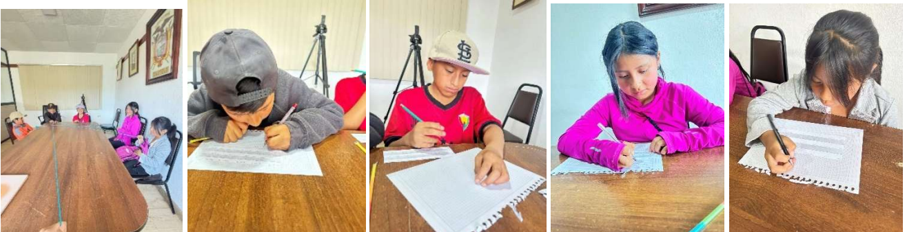
Foto 36: Encuentro recreativo y educativo con niños y niñas de la parroquia